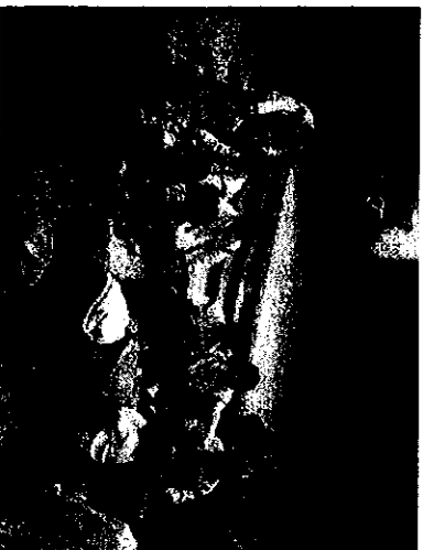
大福國小一日寒令營