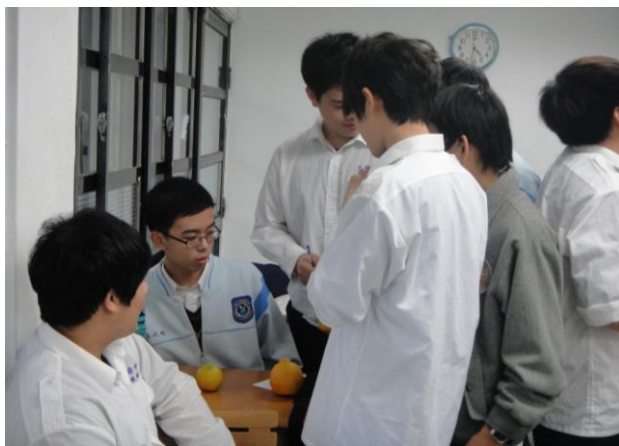
(圖一：組員討論欲推出哪一顆橘子為參賽代表)