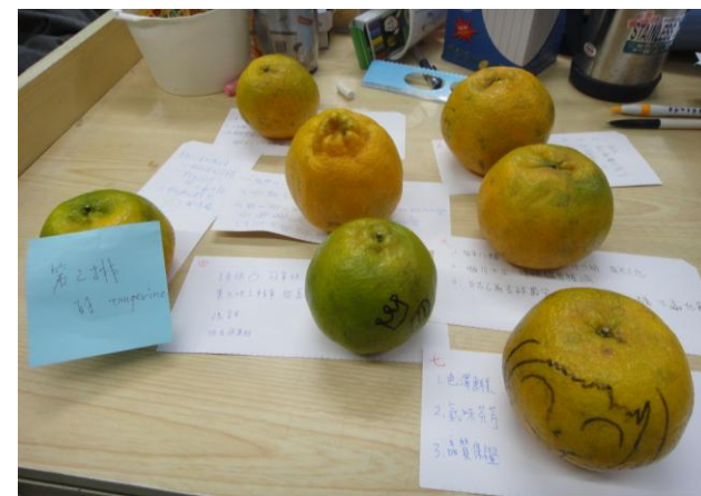
(圖三：七組參賽橘齊聚一堂, 進行最後試吃)