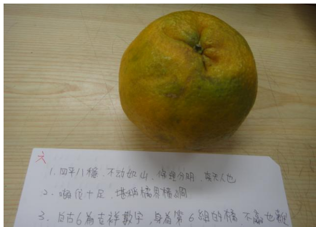
(圖二：針對參賽橘進行廣告宣傳)